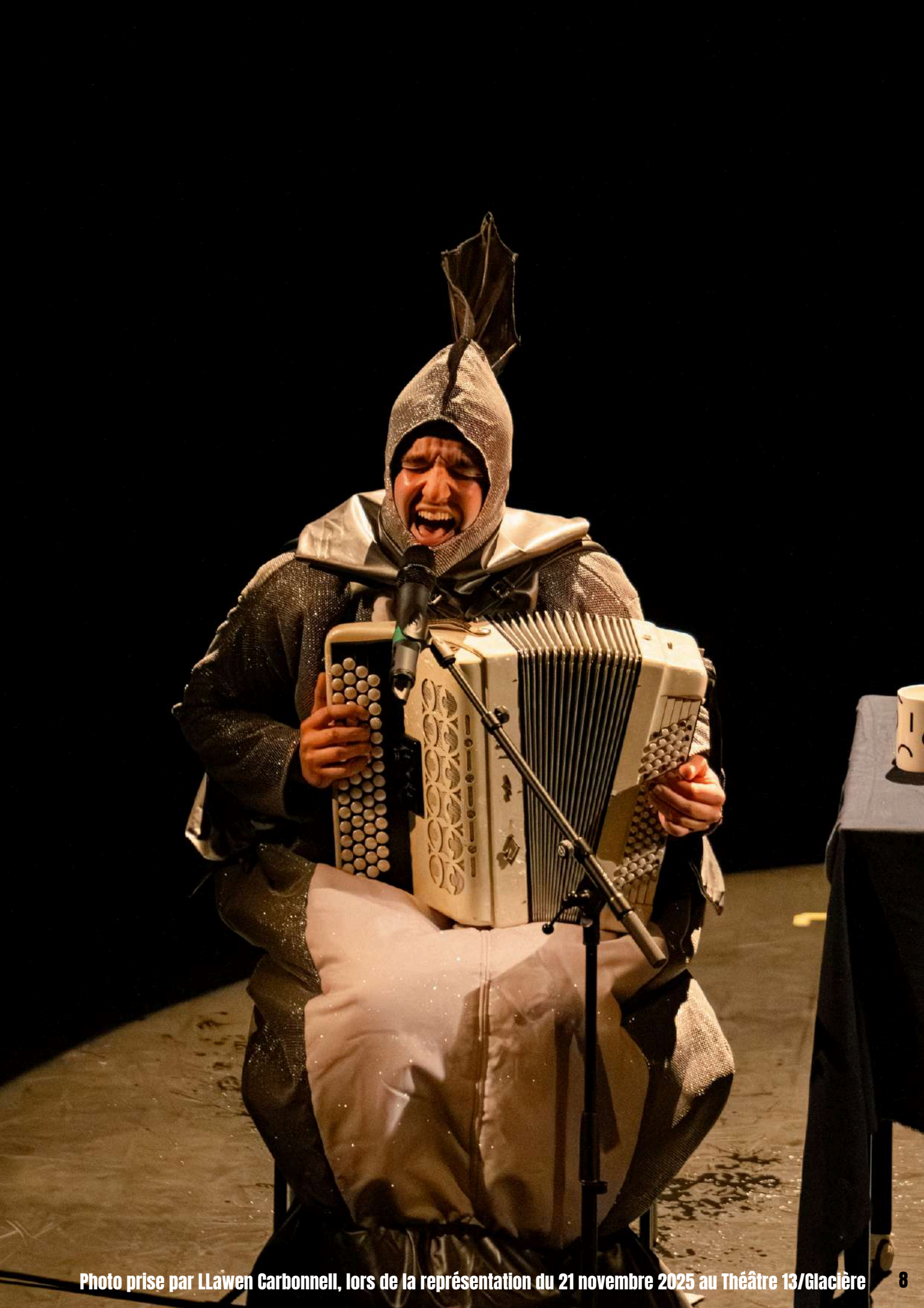
lors de la représentation du 21 novembre 2025 au Théâtre 13/Glacière